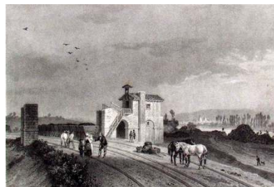
Ligne historique de Saint-Etienne à Andrézieux