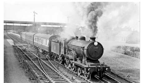
Le train inquiétait les voyageurs

Tout cela ne va pas sans les réticences des passagers : le train surprend et fait peur. Le chemin de fer suscite des inquiétudes pour la santé des voyageurs. Certains croient que la vitesse peut rendre les gens aveugles ou même fous. On met en garde la population contre le passage des tunnels qui entraînerait des fluxions de poitrine ou des pleurésies.