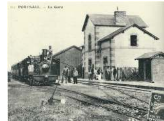
Les gares de Plourin, de Porspoder et de Portsall à l'époque.

La 2 ème étape concerne le transport des passagers : la ligne Paris/Saint-Germain en Laye est inaugurée le 24 août 1837. C'est le début des lignes qui partent de Paris. Les constructions se feront à un rythme accéléré à partir de 1850.