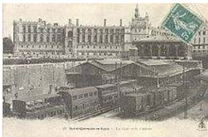
Gare de St Germain en Laye

La 2 ème étape concerne le transport des passagers : la ligne Paris/Saint-Germain en Laye est inaugurée le 24 août 1837. C'est le début des lignes qui partent de Paris. Les constructions se feront à un rythme accéléré à partir de 1850.