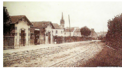
Gare de Plourin

Le train « patate » : la suite de l'histoire ferroviaire, c'est la naissance des « petits trains ». Au vu des nombreuses stations balnéaires et des ports de pêche, le Département a décidé la création de tout un réseau de « petites lignes », appelées ainsi en raison du faible écartement des rails, 1 mètre contre 1,43 m pour les grandes lignes.