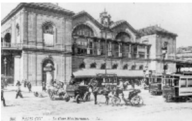
Gare de Montparnasse, Paris

En malle-poste, pratiquement sans s'arrêter, il fallait compter 53 heures, avec un changement de chevaux tous les 35 à 40 km. Ce service était utilisé par quelques voyageurs et surtout pour le courrier. Pour les bretons de l'époque, le train, c'est un grand bond dans la modernité. Toutefois, il y a aussi des râleurs ; devant les bouleversements, quelques bretons se cabrent et poussent un cri d'alarme : « La Foi, la langue bretonne, les traditions sont en péril... ». Malgré ces réticences, le train arrive, et avec lui, des innovations. A Brest, on trouve dans les boutiques de la ville les mêmes articles qu'à Paris. C'est le progrès.