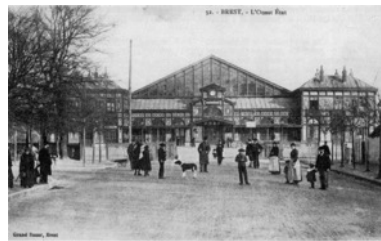
Gare de Brest