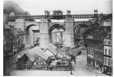
Construction Viaduc de Morlaix, 1863

En malle-poste, pratiquement sans s'arrêter, il fallait compter 53 heures, avec un changement de chevaux tous les 35 à 40 km. Ce service était utilisé par quelques voyageurs et surtout pour le courrier. Pour les bretons de l'époque, le train, c'est un grand bond dans la modernité. Toutefois, il y a aussi des râleurs ; devant les bouleversements, quelques bretons se cabrent et poussent un cri d'alarme : « La Foi, la langue bretonne, les traditions sont en péril... ». Malgré ces réticences, le train arrive, et avec lui, des innovations. A Brest, on trouve dans les boutiques de la ville les mêmes articles qu'à Paris. C'est le progrès.