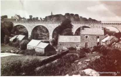
Viaduc de Kersaint 1913, Landunvez

Brest est relié à Paris en 1865, huit ans après Rennes. Il aura fallu construire un ouvrage d'art important, le viaduc de Morlaix. Le trajet de Paris à Brest dure 17 heures. La vitesse moyenne du train est de 37 km/h. Avant cette date, avec le service normal, le moins cher de la diligence, il fallait compter six jours pour aller de Brest à Paris.