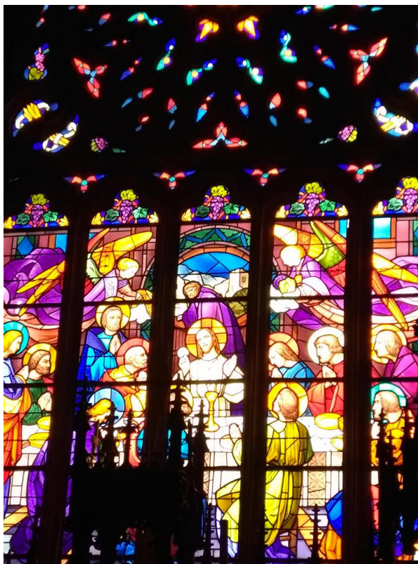
Le grand vitrail de La Cène de l'Église de Plourin.

Lettre originale de l'expédition du grand vitrail de La Cène. Église de Plourin.