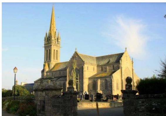
Église Saint Budoc - Plourin